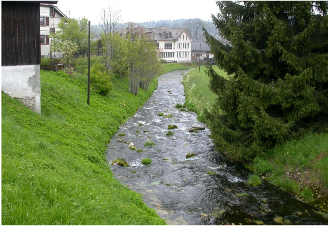
Coule donc, ma belle petite rivière, en ce 15 mai 2014, après plusieurs jours de pluie, passablement bien alimentée.