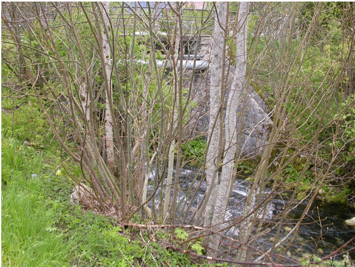
Vue depuis le haut. Autrement dit, on n'y voit rien !